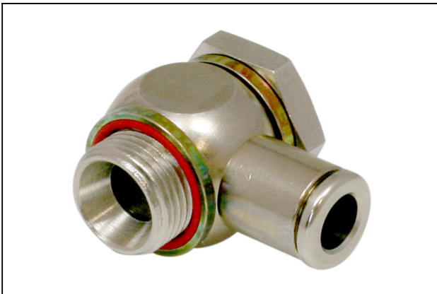
STV-WF G3/8-AG 8