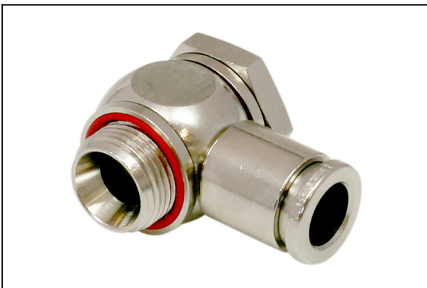
STV-WF G3/8-AG 10