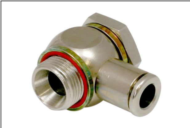
STV-WF G3/8-AG 8