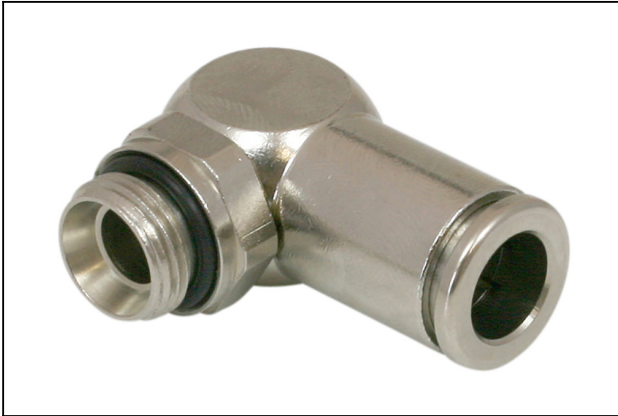
STV-W G3/8-AG 12

https://www.schmalz.net.cn/10.01.02.00878