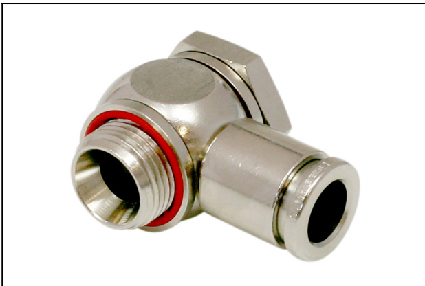
STV-WF G3/8-AG 10